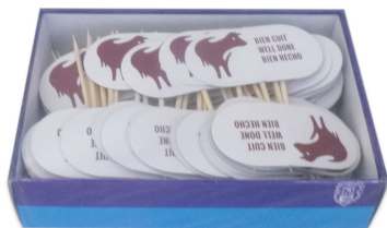
Image du paquet

Règlement (CE) n° 2023/2006 de la Commission du 22 décembre 2006 relatif aux bonnes pratiques de fabrication des matériaux et objets destinés à entrer en contact avec des denrées alimentaires.